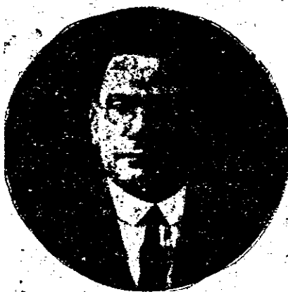
Secretario de Agricultura y Obras Públicas, jurisconsulto de nota y gran orador.