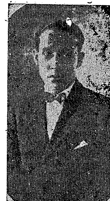
Miembro destacado del oro Nacional, quien será agasgado con un banquete, por un grupo de sus amigos, con motivo de su reciente nombramiento.

ALCOHOLADO BOLIVAR Aromático - Antiséptico y de propiedades sin rival para fricciones.