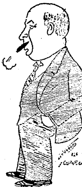
Un distinguido y conocido hombre de negocios

la tuberculosis que llena de desgraciados parásitos a nuestra sociedad y de cruces nuestros cementerios; microbios de tantas enfermedades muchas de ellas que llevan el dolor humano hasta la tragedia repugnante; microbios que se esparcen en el aire, que se ponen en contacto con los pies desnudos, con las manos juguetonas y muchas veces con los labios mismos de los niños que se llevan las manos a la boca.